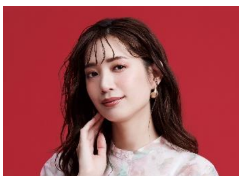
←ふんわり香り立つ花びらのようなフェミニンな印象